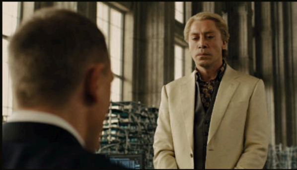
Silva ile yüzleşme — Bardem, Bond'un karanlık aynası.