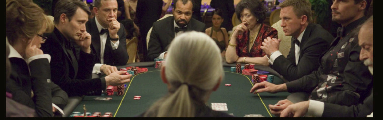
Kumar masası — Campbell aksiyonu durdurur, kareye nefes verir; Bond yıllar sonra ilk kez sözsüz oynar.

1995'te Brosnan'ı, 2006'da Craig'i koltuğa oturttu. Aynı yönetmen, iki ayrı yeniden başlangıç.