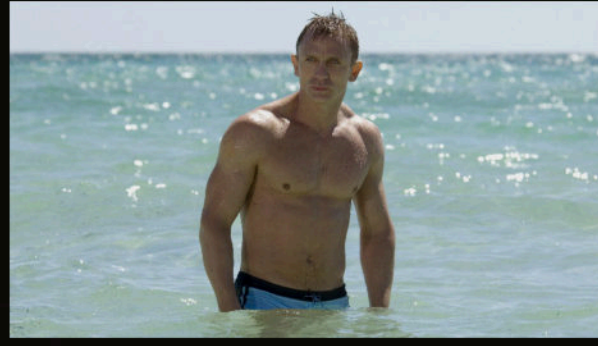
Bahamalar — Bond'un fiziği, gerçek bedenler ve gerçek deniz.