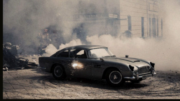
DB5 dumanın içinde — kurşunla yıkanmış meydan.