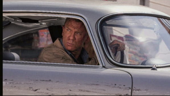
Madeleine'le DB5'te — son kez hep beraber.