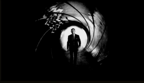
Gun-barrel — Bond, kameranın karşısında siyah-beyaz silüet.

Bond, Sévérine, Silva, M ve bir DB5 — filmde geriye kalan yüzler ve bedenler.