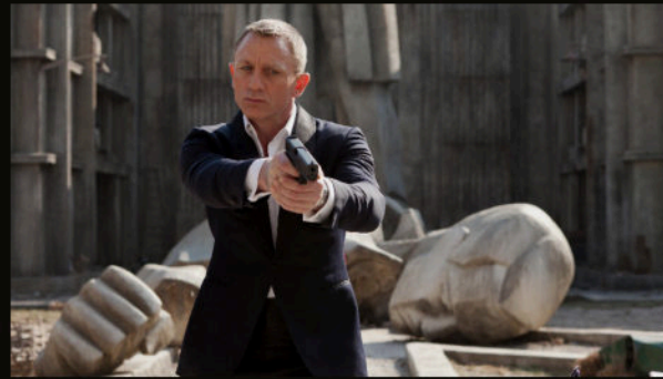
Terk edilmiş ada — Deakins'in gri tonları ve sessizliği.