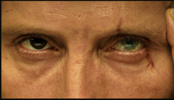
Le Chiffre'in kanlı sklera'sı — kötülüğün soğuk biyolojisi.