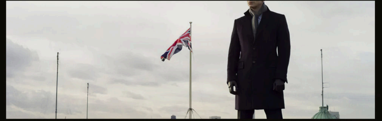
M16 çatısında — Deakins'in geniş açılı kompozisyonu, Bond'u Londra'nın üzerinde yalnız bir silüet olarak kurar.

Skyfall, franchise tarihinin ilk dijital çekim filmi. ARRI Alexa'da çekildi. Deakins, fotoğraf tarihine girecek karelere imza attı.