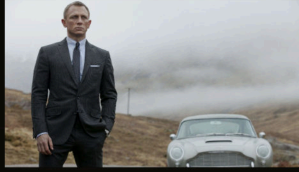
İskoçya yolu — Aston Martin DB5 ve sis.