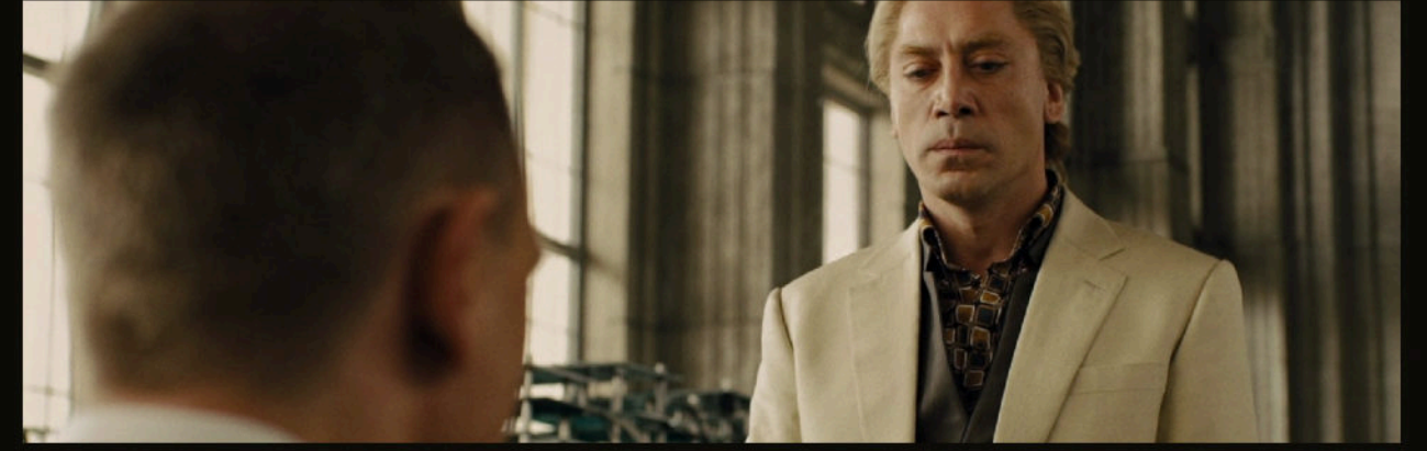
Bond ve Silva — Mendes, kahramanın karşısına onun karanlık aynasını koyar.

American Beauty'den Skyfall'a — Mendes hep aynı şeyi yapıyordu: kahramanın kalbine bakmak.