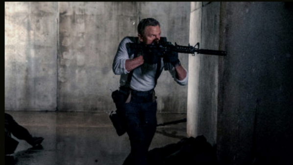
Final ada — Bond'un son nefes mekânı.