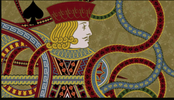
Açılış jeneriği — kart desenleri ve Daniel Kleinman'ın imzası.

Bir filmde geriye kalan; bir karakterin yüzü ve yanına aldıkları.