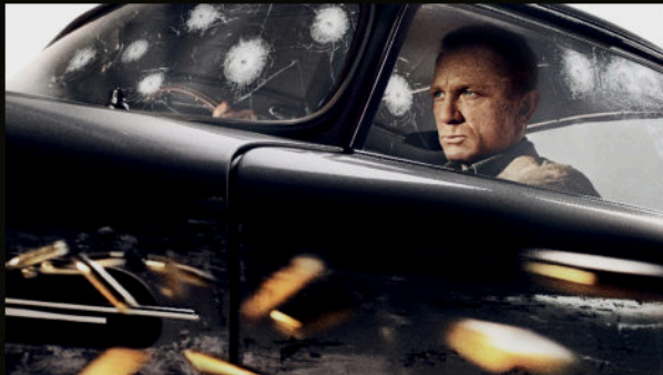
DB5'in kurşun delikli camında — Bond'un son sürüşü.