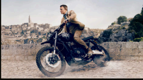
Matera — Bond'un son motoru, son taş yolları.

Bond, Madeleine, Paloma, bir DB5 ve Norveç ormanları — bir vedanın görsel haritası.