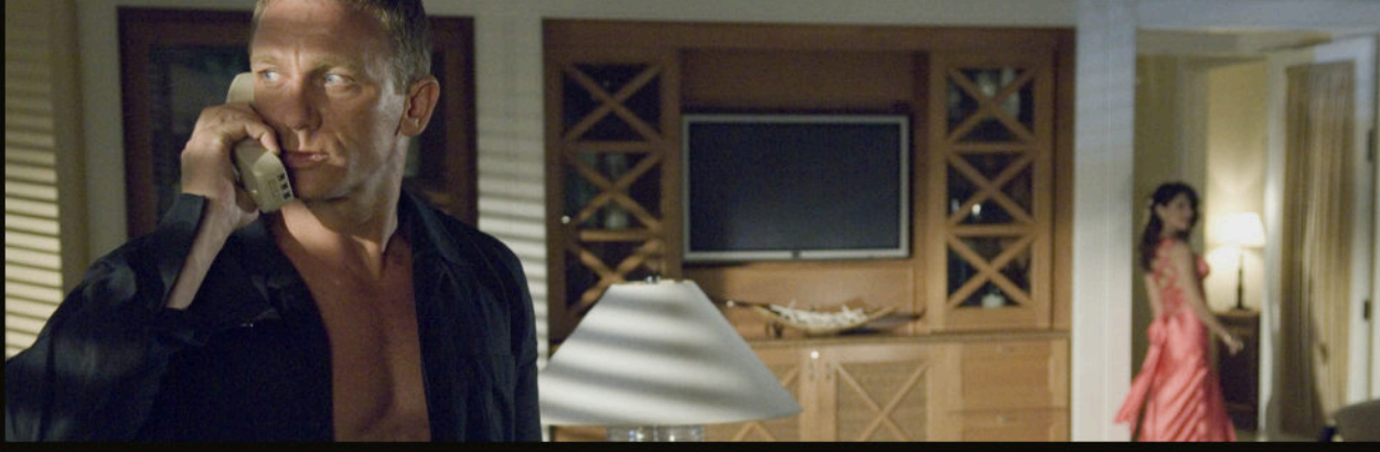
Bahamalar oteli — Craig'in erken Bond sahnelerinden biri. Henüz tanıdığımız adam değil; ama olacak olan.

2005'te ilanı çıktığında toplu bir protesto vardı. Bir yıl sonra herkes susmuştu — ve seyirci, beklediğinin başkasını gördüğünü fark etti.