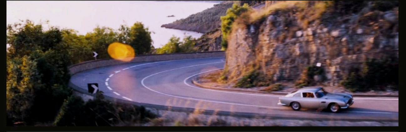
Aston Martin DB5, İtalyan kıyı yolunda — bir veda yolculuğunun başlangıç karesi.

True Detective'in ilk sezonunu yöneten yönetmen, Bond'a duygusal kapanış getirdi. Yanında Phoebe Waller-Bridge; arkasında Linus Sandgren.