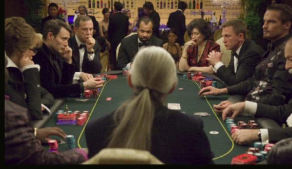
Kumar masası — Le Chiffre, Bond ve dört oyuncu, sözsüz savaş.