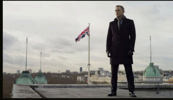
MI6 çatısı — Bond Londra'ya geri dönmüştür.